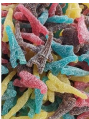
Bonbons offerts aux enfants