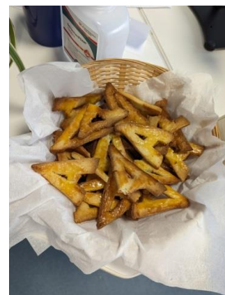
Sablés en forme tour Eiffel confectionnés par Nicole