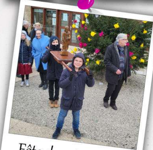
Fête des vigneronns