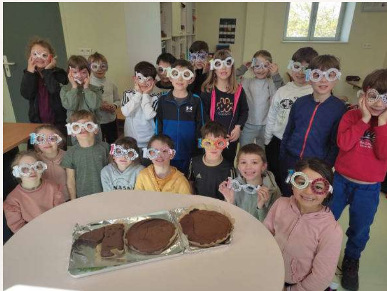
Le 100ème jour de classe pour les CP - CE1