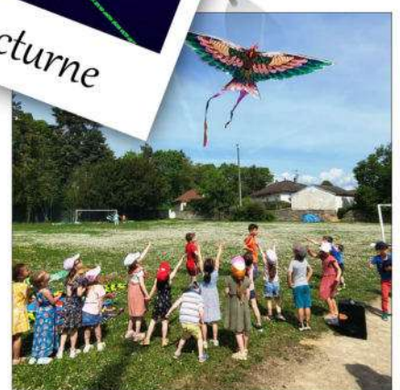
Spectacle cerfs volants