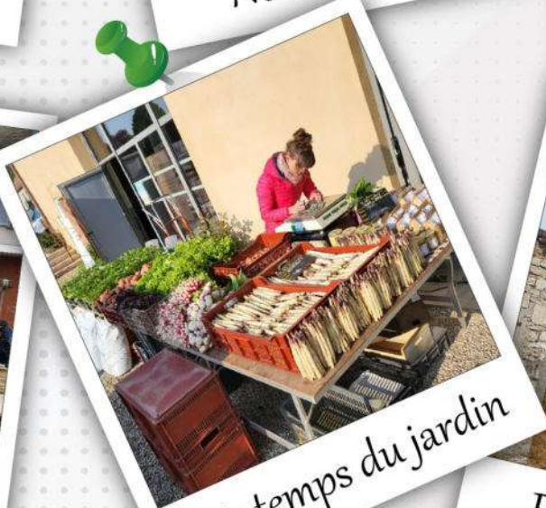
Printemps du jardin