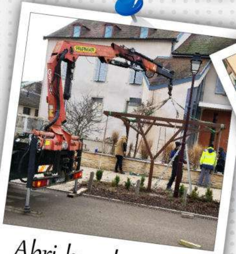
Abri-bus des écoles